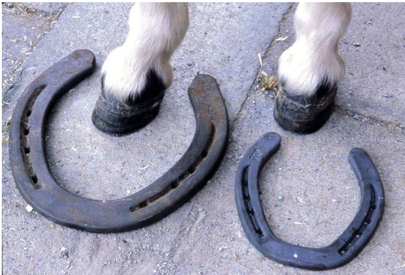
FOTO NEIL SODERSTROM (FRÅN "PANDA, A GUIDEHORSE FOR ANN", AV ROSANNA HANSEN, Boyds Mills Press, www.boydmillspress.com )

En svensk uppfödare av miniatyrhästar: www.vreten.net/mini/index.html