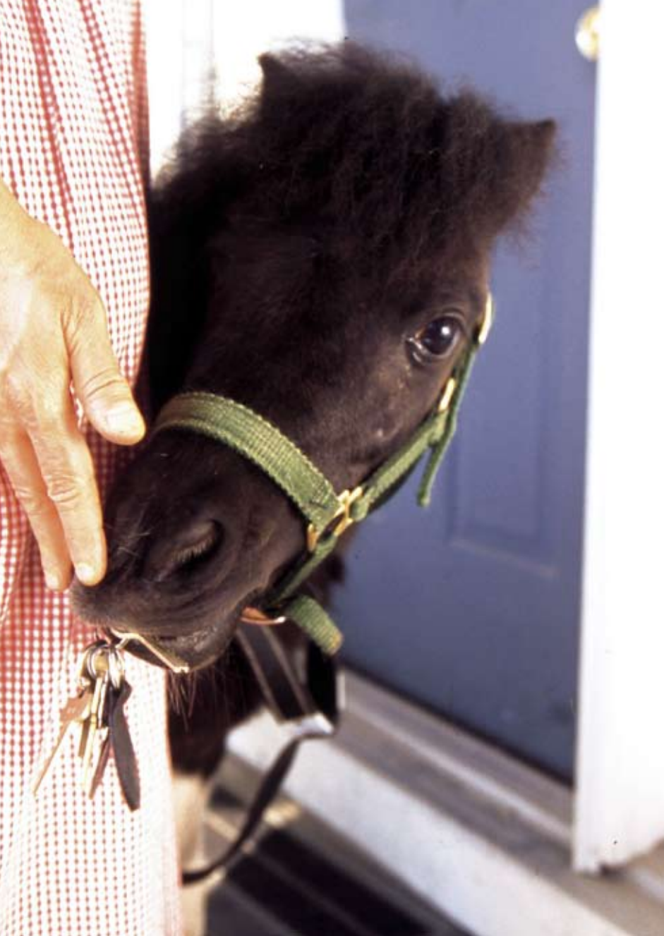
FOTO NEIL SODERSTROM (FRÅN "PANDA, A GUIDEHORSE FOR ANN" AV ROSANNA HANSEN, Boyds Mills Press, www.boydmillspress.com )