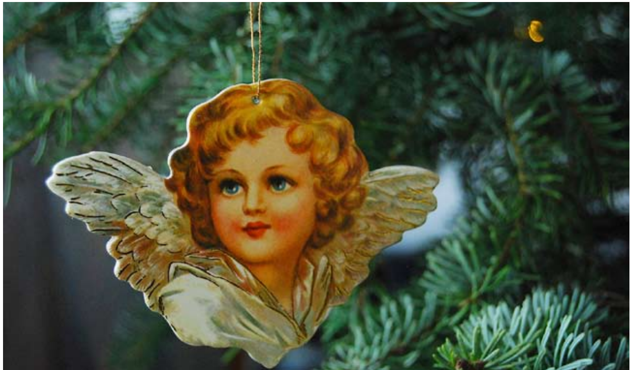
DET FINNS MÅNGA tillfällen att komma i julstämning i Vellinge framöver.

■ Julmarknad i Skanör anordnas den 9 december klockan 11-16. För andra året i rad blir det julmarknad i Skanör med julsång, tomte, godis till alla barn, glöggservering, chokladfon-